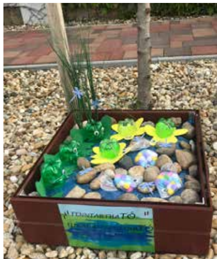
II. helyzett Kiserdei Óvoda kiscsoport