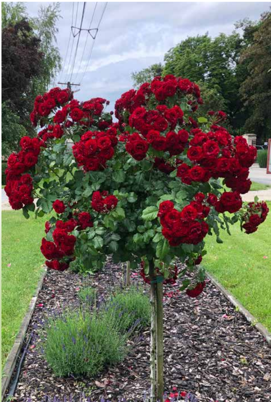
Reményik Sándor : Hajnali rózsák

A kert hajába rózsalugasok tűznek virágokat. Szivárvány - arcukról a Nap mosolyog. Leveikkel fűrészelgetik a levegőt; ing és billeg a tér,