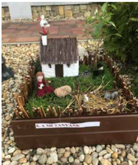
I. helyzett Szakály család