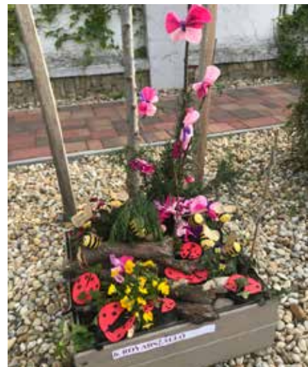
III. helyezett Kiserdei Óvoda középső csoport