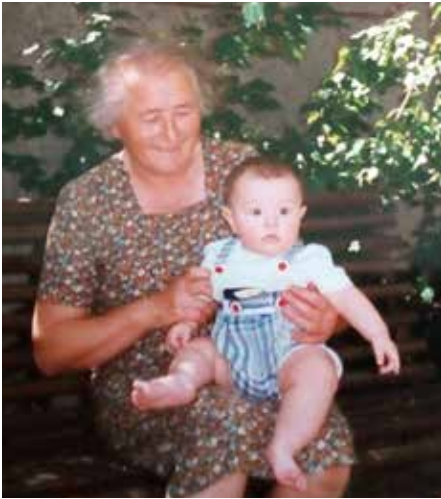
Az egyik kisunokával