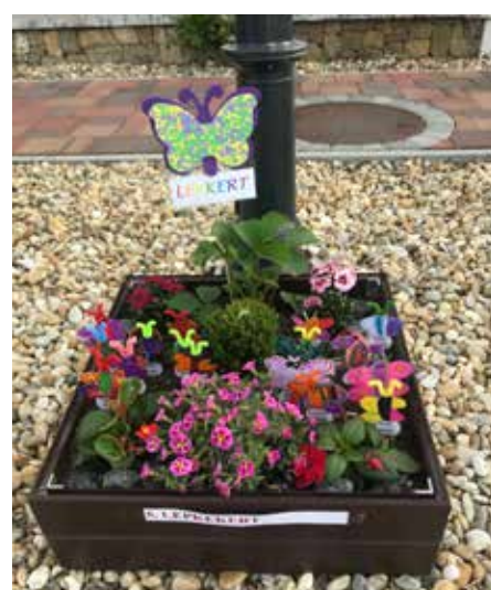
Kiserdei Óvoda nagycsoport