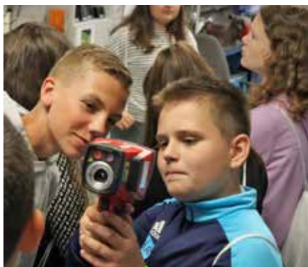
PÁLYAORIENTÁCIÓS NAP A VERITASBAN