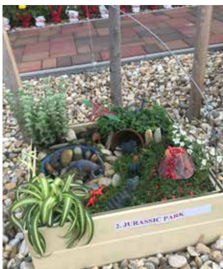
Közönségdíjas Karimi család