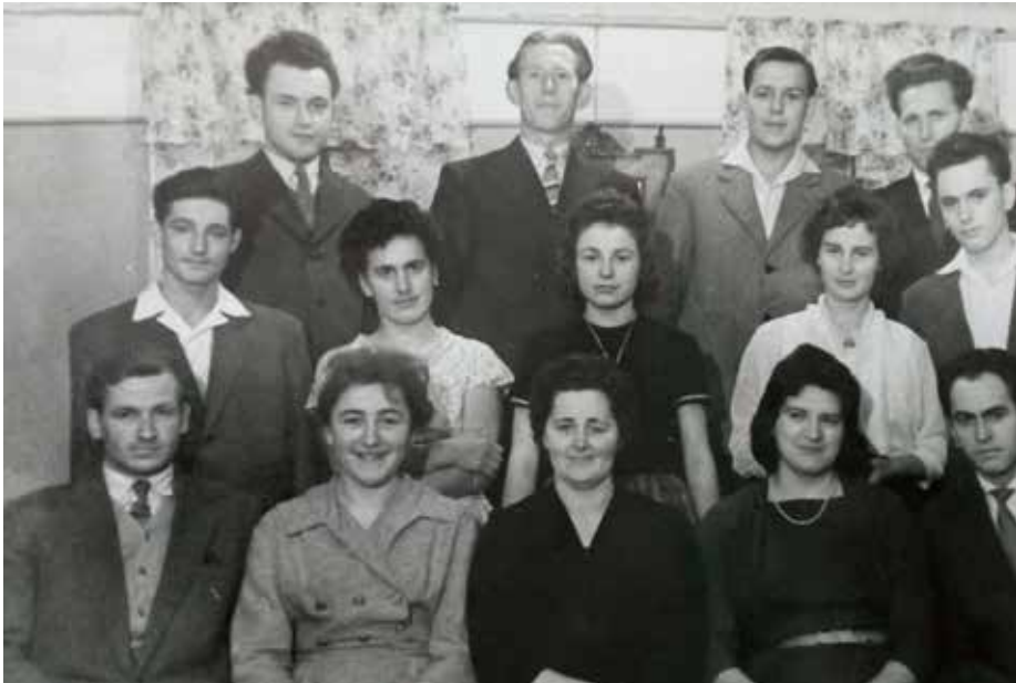
A színjátszó csapat