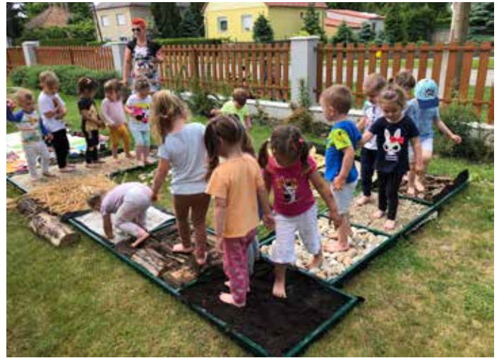
A meztálas ösvény volt a bölcsisiek gyermeknapj ajándéka